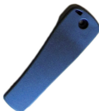
Bælteclip og håndstrop