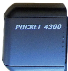
Ekstra Ni-Mh batteri